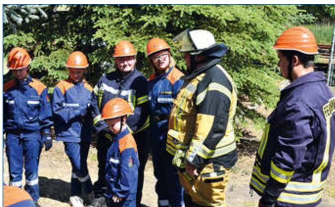
1 Person eingeklemmt Gelände Lokschuppen