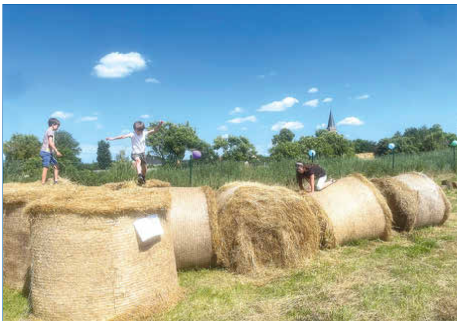
Am 1. Sonntag jeden Monats können sich auch zukünftig Zwei- und Vierbeiner in den eingezäunten Ausläufen austoben.

fanden hier ihr letztes Zuhause. Die meisten Schützlinge konnten in eine verständnisvollere Zukunft weiterziehen.