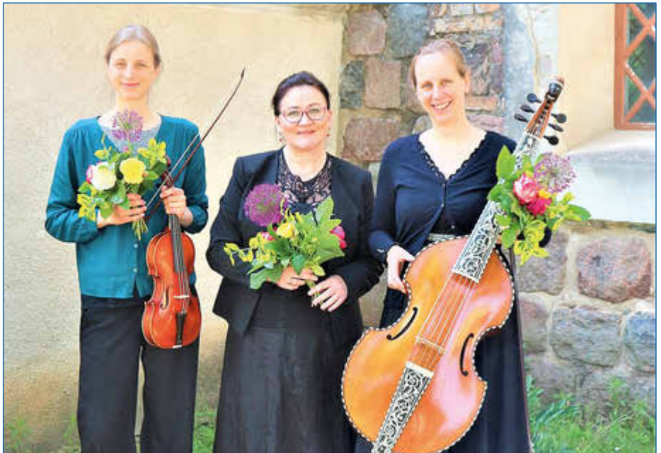
Das Collegium für Alte Musik Vorpommern gastierte in Wartin.