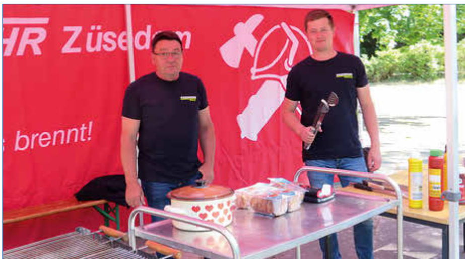
Die Züsedomer Kameraden der Feuerwehr übernehmen das Grillen.