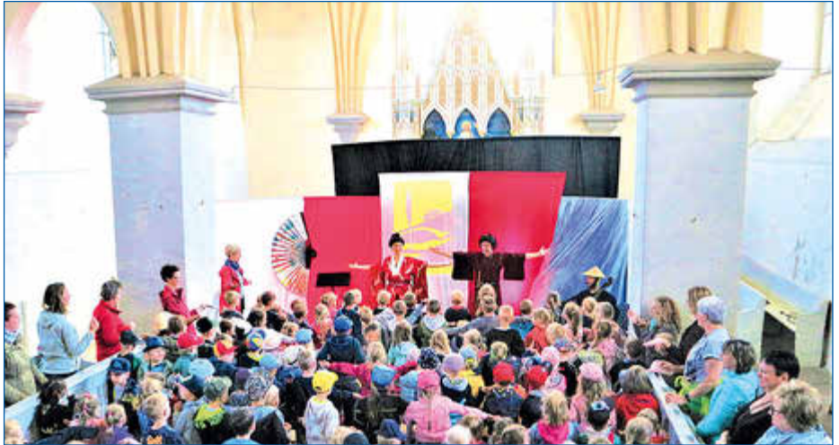
Beim Kinderkonzert DrachenErwachen wurde getanzt und gesungen.