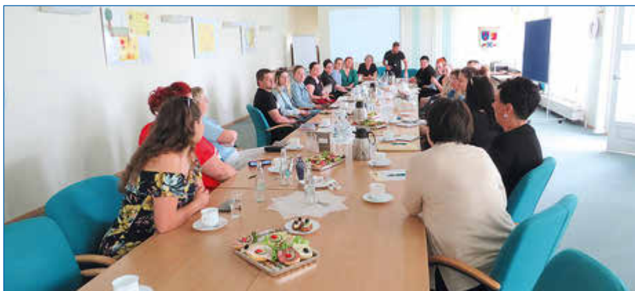
Die Aussteller waren der Einladung zur ersten Beratung zahlreich gefolgt.

38 Aussteller haben bisher zugesagt. Sie werden den Besuchern, die ein Fest planen, viele Dienstleistungen und Produkte