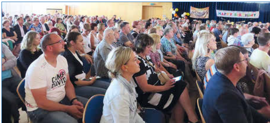
Viele Eltern, Großeltern und Geschwister, aber auch Freunde und Förderer waren zum Jubiläum der Nikolaischule gekommen.