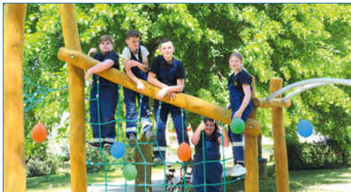
Die Mitglieder der Jugendfeuerwehr Damerow nahmen die neuen Spielgeräte in Besitz und waren voll des Lobes.