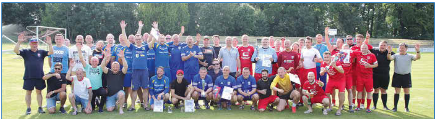
Gemeinsames Erinnerungsfoto der Ü35-Mannschaften nach dem Turnier.