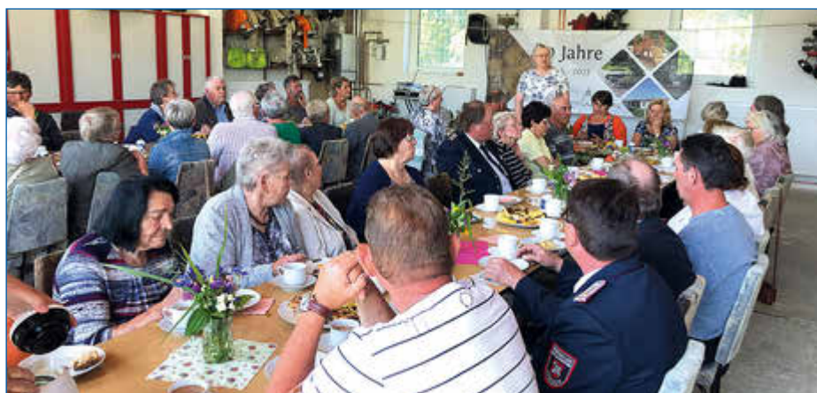
Die Gäste ließen sich den von den Landfrauen gebackenen Kuchen schmecken.