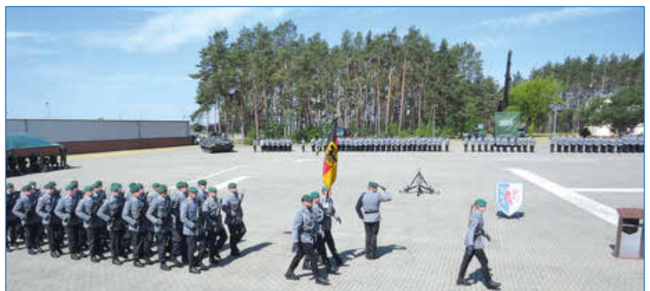
Einmarsch der Soldatinnen und Soldaten.