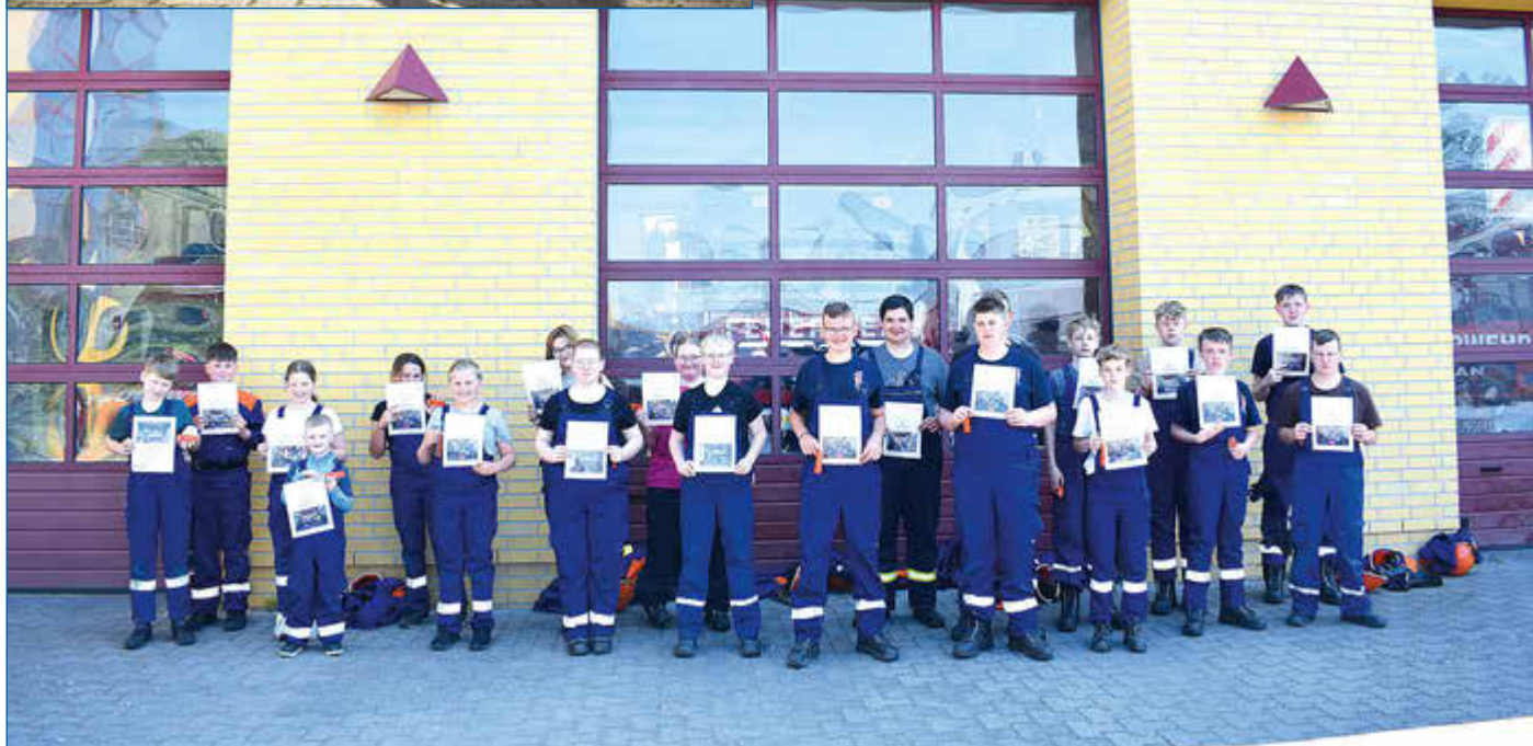
Jeder Teilnehmer und jede Teilnehmerin bekam eine Urkunde.