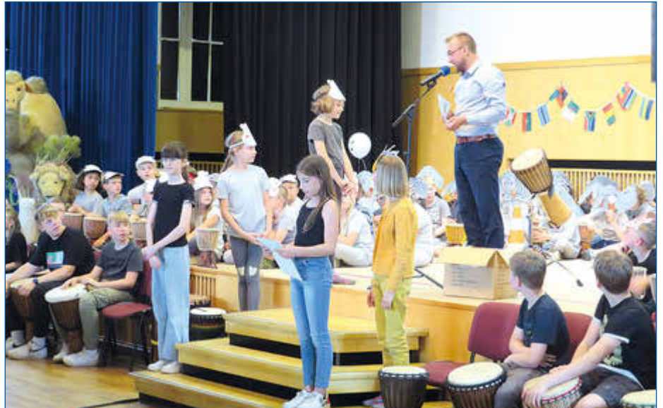
Der Regionaldirektor der VR-Bank Uckermark-Randow eG zeichnete die Preisträger des diesjährigen Wettbewerbs aus.

Der kaufmännische Vorstand der Schulstiftung der Evangelisch-Lutherischen Kirche Norddeutschland Gunther Wiese