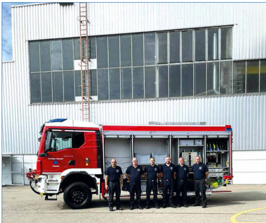
Die Freude über das neue Tanklöschfahrzeug ist groß.

(PN/PM). Mit der Fördermittelzusage 2021 konnte das Projekt zukunftsfähige Freiwillige Feuerwehr Pasewalk weiter auf den Weg gebracht werden. Eigentlich sollte die Indienststellung schon im Jahr 2022 erfolgen. Durch die aktuelle Lage auf den Märkten und den Auswirkungen der COVID-19-Pandemie verschob sich der Zeitplan. Nun war es soweit. Am 03.07.2023 starteten 6 Kameraden unserer Wehr in Richtung Ulm zur Abholung bzw. zur Einweisung in die neue Löschtechnik. In 2 Tagen erfolgte die Einweisung am TLF 4000. Mit vielen technischen Informationen erfolgte dann am 05.07.2023 die Überführung nach Pasewalk. In den kommenden Wochen werden dann die Maschinisten, sowie die Kameradinnen und Kameraden, in das TLF 4000 eingewiesen und der Umgang mit der Technik geschult. Am 16.09.2023 wird das TLF 4000 offiziell, im Rahmen eines Tages der offenen Tür, von 13:00-17:00 Uhr durch den Bürgermeister übergeben.