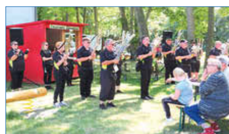
Die Schalmee-Musikanten-Mühlhof e. V. in Züsedom.