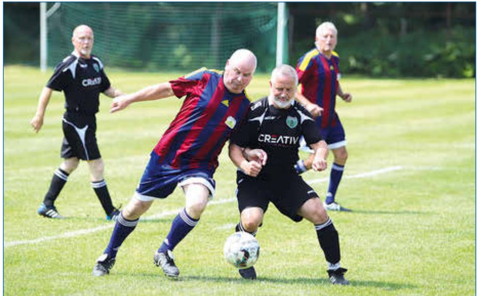
Spielszene aus dem Spiel der Ü50, Löcknitz-Gramzow