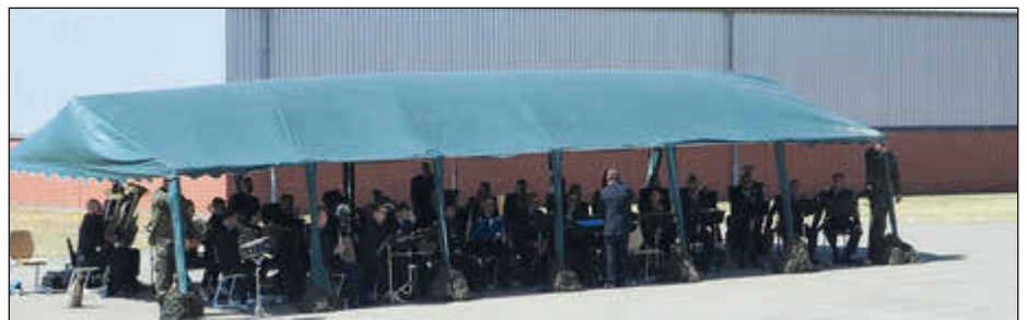
Das Bundespolizeiiorchester übernahm die musikalische Umrahmung der feierlichen Übergabe.