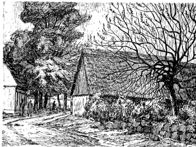
Totensonntag in Batin.

..erinnert mit einem Gedicht von Max Lindow an den Totensonntag am 22.11.2020