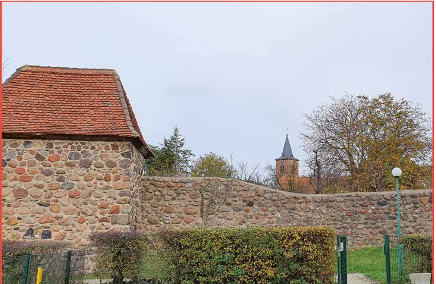
Brüssower Stadtmauer mit Wiekhaus im Herbst