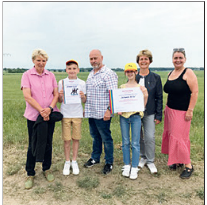
Preisverleihung am 11.06.2022