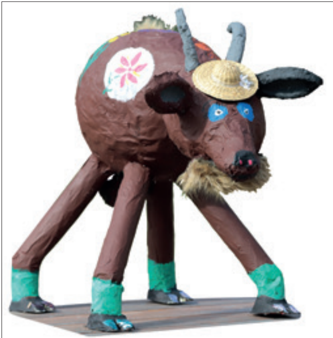
Ziegenbock Eduard Sonnenschein