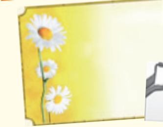
Wohnungsvermietung oder -gesuche