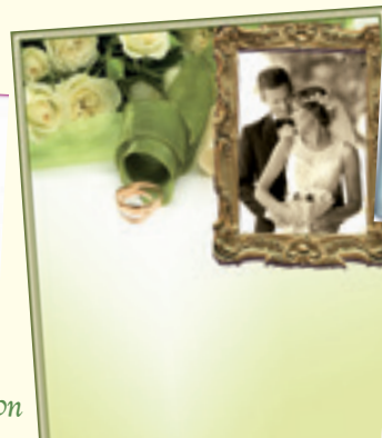
Geburtstag, Ehejubiläum & Hochzeit