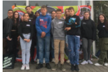
Diese jungen Menschen entscheiden im Zukunftsausschuss über die Vergabe der Gelder.

Wichtig ist, dass die Zielgruppe bei der Planung und Umsetzung der Angebote und Projekte beteiligt ist! Im besten Falle sind sie selbst die Initiator*innen und haben für ihre Idee den Hut auf. Ideen und Anträge von Kindern und Jugendlichen finden besondere Berücksichtigung, ebenso Projekte für 14 bis 17-Jährige.