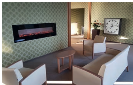
Blick in die Räumlichkeiten der Tagespflege „Peter Kolata“

Ergänzend zur häuslichen Pflege kann sich jeder Pflegebedürftige oder auch dessen Angehöriger Entlastungsleistungen wählen. Diese sind keineswegs auf einen Sachleistungsbetrag von bis zu 125 Euro beschränkt, sondern werden durch die Pflegekasse in voller Höhe des Sachleistungsbetrags Ihres Pflegegrades gewährt, wenn eine Tagespflege in Anspruch genommen wird. Damit kann Ihr pflegebedürftiger Familienangehöriger tagsüber pflegefachlich professionell versorgt und gepflegt werden. Sie sind in der Zeit des Besuchs in der Tagespflege von der Doppelbelastung befreit und wissen doch, dass es Ihrem Angehörigen gut geht.