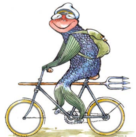
Stadtmaskottchen Ueckerich ist auch auf dem Fahrrad unterwegs.

bieren und sich über Tipps und Trends in der Fahrradindustrie zu informieren. Experten stehen für Fragen und Ratschläge rund um das Rad zur Verfügung. Die Veranstaltung ist nicht nur eine Gelegenheit für Fahrradenthusiasten, neue Modelle kennenzulernen, sondern auch für diejenigen, die sich für gesunde Lebensstile und umweltfreundliche Fortbewegungsmittel interessieren. Die Hausmesse bietet einen umfassenden Einblick in die Vielfalt der Fahrradwelt und ermöglicht es den Besuchern, sich von Experten beraten zu lassen. Das Fahrradgeschäft lädt alle Interessierten herzlich ein, an der Hausmesse teilzunehmen und die Welt der Fahrräder zu entdecken.