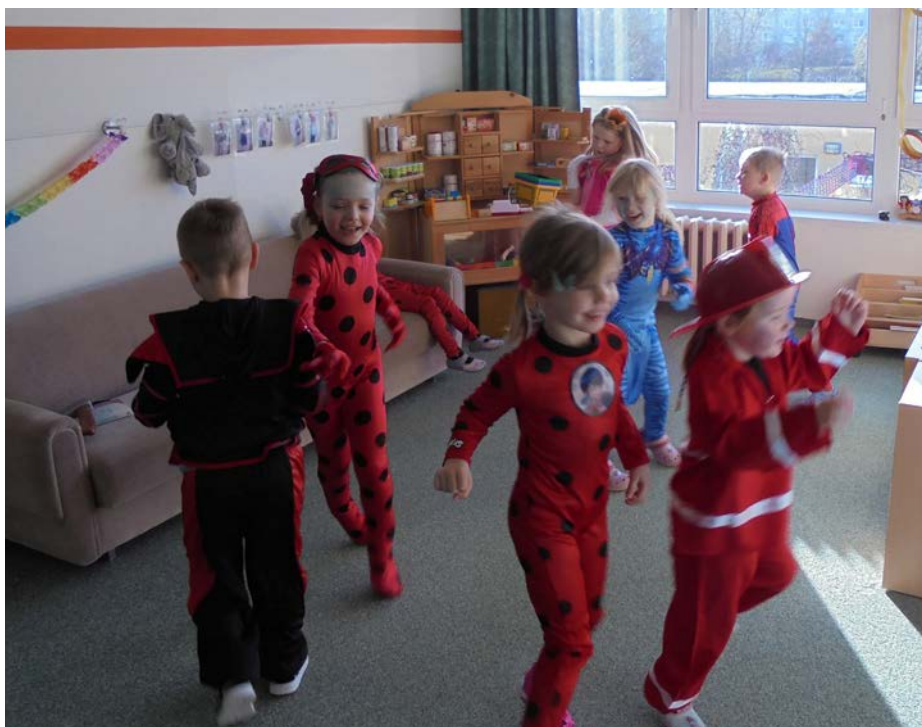
Buntes Treiben in der Kita Haffring mit Ladybug, Spiderman an Co.

Ein großes Dankeschön geht an alle Eltern. Sie haben das Frühstücksbuffet variationsreich mitgestaltet.