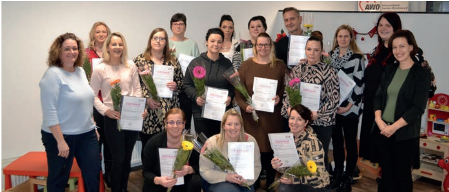
Erfolgreiche Teilnehmer und Teilnehmerinnen mit ihren Zertifikaten

Die Inklusionsassistenten sind nun in Schulen, Kindergärten und sozialen Organisationen tätig. Ihre vielfältigen Aufgaben umfassen nicht nur die individuelle Unterstützung von Menschen mit unterschiedlichen Bedürfnissen, sondern auch die Förderung eines inklusiven Umfelds, in dem jeder Mensch unabhängig von seinen Fähigkeiten und Unterschieden akzeptiert wird. Im Rahmen der Zertifikatsübergabe wurde die Zeit auch intensiv für den Austausch genutzt. Positives Feedback und die Notwendigkeit von Inklusion standen hierbei im Fokus der Diskussion. Die Teilnehmer betonten die Relevanz ihrer neuen Qualifikationen für ihre tägliche Arbeit und die erfolgreichen Auswirkungen auf die Menschen, die sie unterstützen.