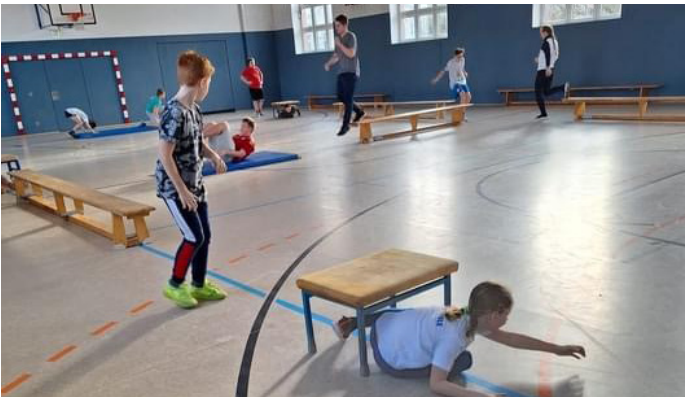
Die Jugendfeuerwehr Ueckermünde trainiert in der Turnhalle der Regionalen Schule Ehm-Welk.

Mit Spiel und Spaß können die Kids dann die Aufgaben der Feuerwehr erlernen und gemeinsam mit Gleichgesinnten spannende Stunden zu verbringen.