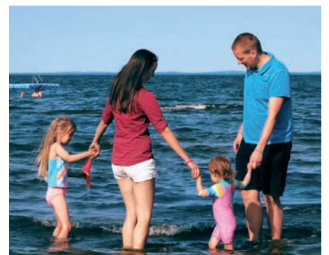
Szene aus dem neuen Imagefilm

deckt hatte und für die Filmaufnahmen gerne noch öfter in die Region kam.