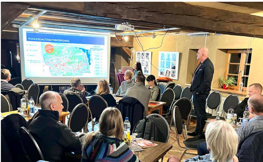
Bürgermeister Jürgen Kliewe erläutert die Themen für den 2. Altstadtspaziergang am 11. Mai. Weitere Vorschläge und Ideen für Aktivitäten sind herzlich willkommen.

Der 4. Altstadtstammtisch war eine erfolgreiche Veranstaltung, und die Teilnehmer freuen sich auf die Umsetzung der besprochenen Ideen für eine blühende Altstadt in Ueckermünde. Der nächste Stammtisch ist am 9. April geplant.