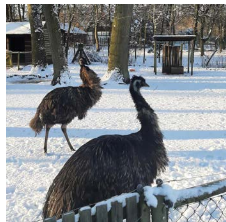
Die Emus stapfen durch den Schnee.

Einem wiederholten und kostengünstigen Tierparkbesuch, auch im Jahr 2024, steht damit nichts mehr im Wege. Jahreskarteninhaber können also den Tierpark Ueckermünde an 363 Tagen im Jahr erleben und haben sich so auch die vielen geplanten Sonderveranstaltungen gesichert.