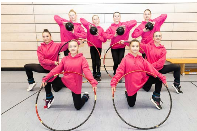
13 bis 15jährige Gymnastinnen des Team 1

Der Verein ist davon überzeugt, dass die Deutschen Meisterschaften Gymnastik und Tanz mit Unterstützung der Ueckermünder und Ueckermünderinnen zu einem unvergesslichen Sportereignis im Seebad Ueckermünde werden und bedankt sich im Voraus für jede Hilfe.