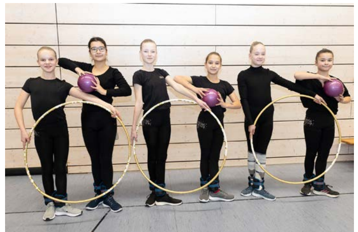
10 und 11jährige Gymnastinnen des Team 2