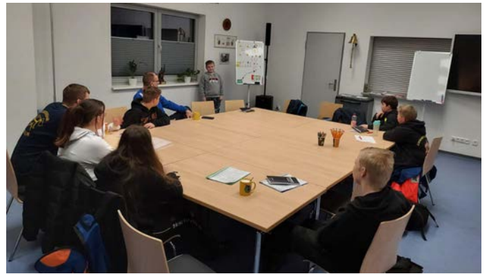
Die Jugendfeuerwehr Bellin arbeitet an ihrer theoretischen Grundlage für die Feuerwehrarbeit