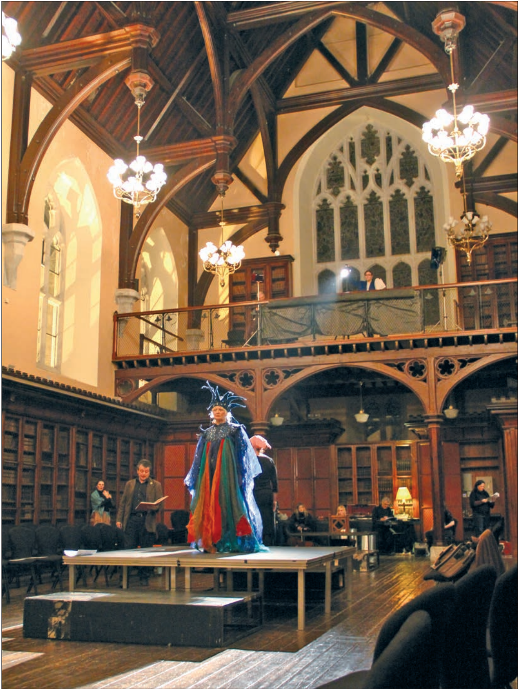
Während der Probe in der Aula Maxima During rehearsal in the Aula Maxima