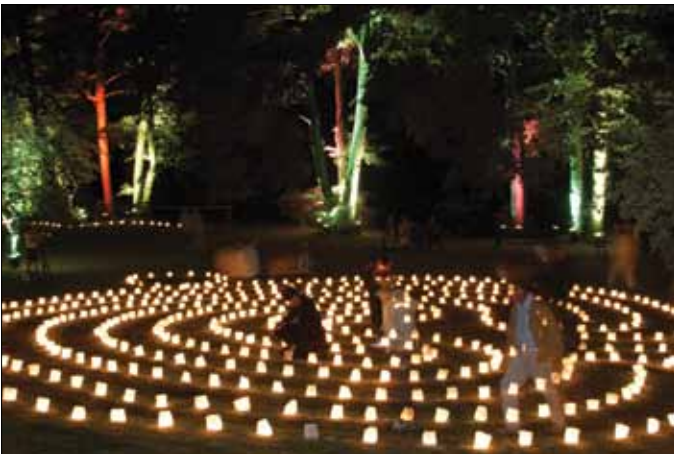
Abb. 3: Zu den Wasserspielen Templin 2007 zeigte das Theater Anu aus Berlin seine Parkszenierung „Lichtspuren“ am Seeufer und auf dem Gelände rund um das MKC und die Stadtverwaltung. Mit mehr als 400 Scheinwerfern wurde das Areal in ein zauberhaftes Licht getaucht, Schattentheater, Tanz und Installationen entführten die Besucher in eine andere Welt. 10 Helfer entzündeten in einer Stunde mehr als 1000 Kerzen und formten diese u.a. zu einem Labyrinth aus kleinen Lichtern.