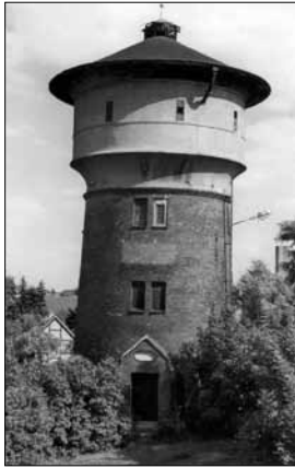
Abb. 2: Wasserturm auf dem Gelände des Bahnhofes Templin (Foto vom 10. Juli 2006 von Bernhard Herzog, Templin)

1887 sind das Templiner Bahnhofsempfangsgebäude sowie die für einen Dampfbetrieb erforderlichen bahntechnischen Anlagen, wie Wasserturm, Wasserkran, Drehscheibe, kleiner Lokschuppen, mechanisches Stellwerk, u.a. fertiggestellt worden. (Abb. 2)