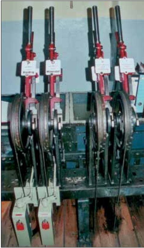
Abb. 24: Signal-Hebel (rot) des mechanischen Stellwerks Templin (Foto vom 18. Nov. 2009, Bernhard Herzog, Templin)