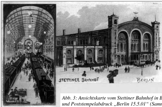
Abb. 3: Ansichtskarte vom Stettiner Bahnhof in Berlin mit 5 Pf Germania-Marke und Poststempelabdruck „Berlin 15.5.01“

Die Regionalbahn 12 fährt seitdem über den ehemaligen DDR-Außenring über Hohenschönhausen nach Oranienburg und weiter über