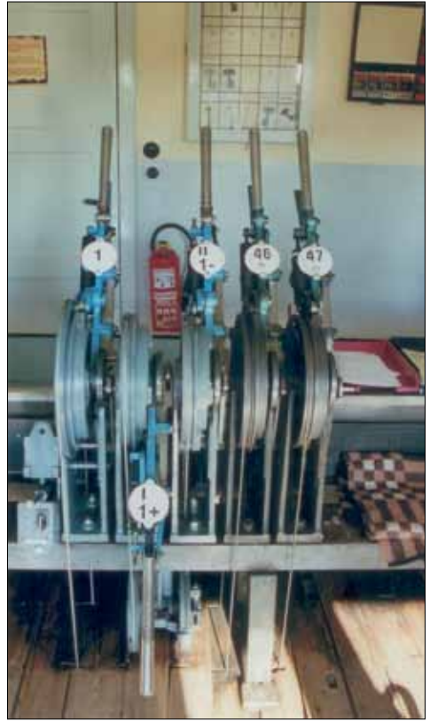
Abb. 25: Blaue Hebel für Weichen des mechanischen Stellwerks Templin (Foto vom 21. Aug. 2006, Bernhard Herzog, Templin)