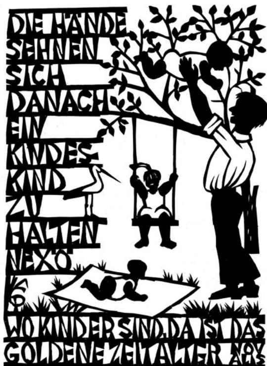
Kinder Scherenschnitt von Gerda Pohl