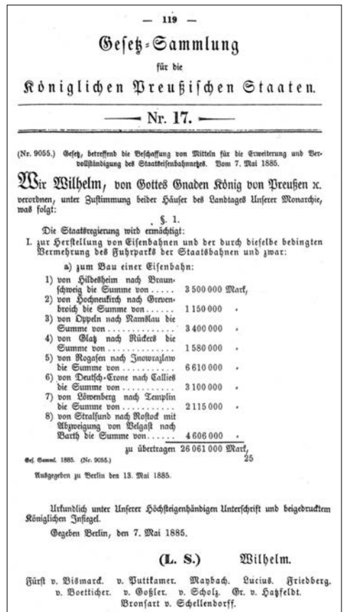
Abb. 1: Auszug aus der Königlich Preussischen Gesetzessammlung von 1885

Am 21. September 1886 war Angebotschlussstermin für die Öffentliche Ausschreibung der Allgemeinen Erdarbeiten sowie