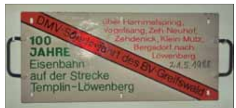
Abb. 26: Farbkopie vom Zuglaufschild

An die Wagen wurden eigens hergestellte Zuglaufschilder eingehängt. (Abb. 26)