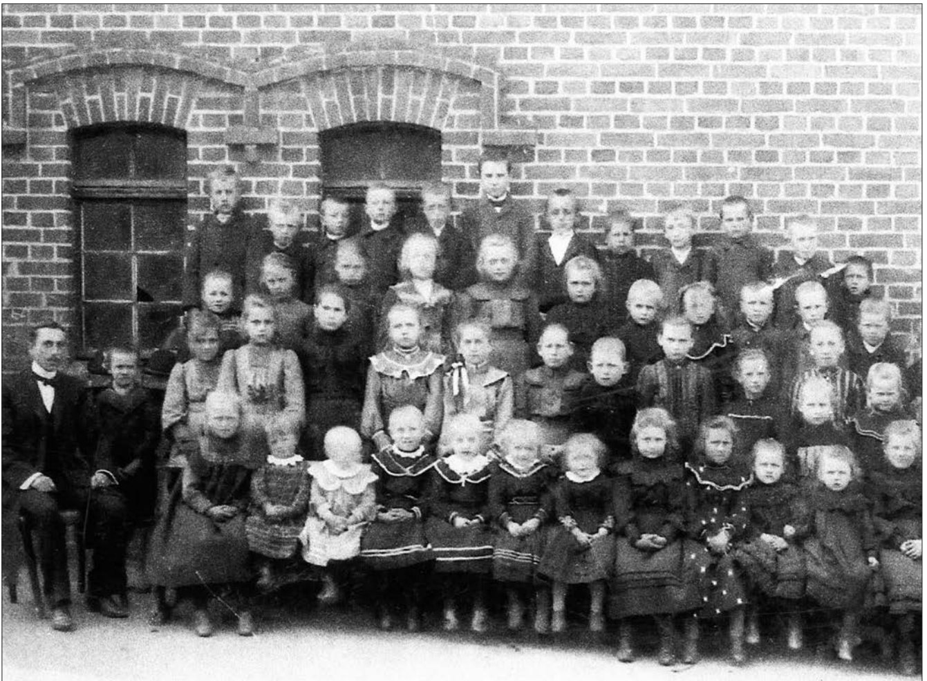
Schulklassen vor der alten Schule (heutige Poststraße), wahrscheinlich um 1910