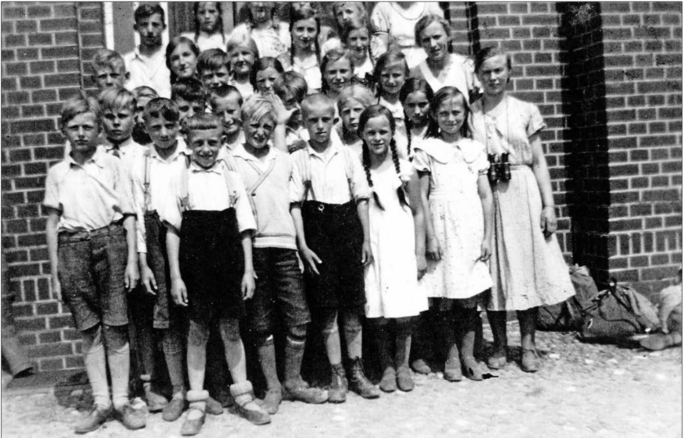
Schüler vor der alten Jagower Schule