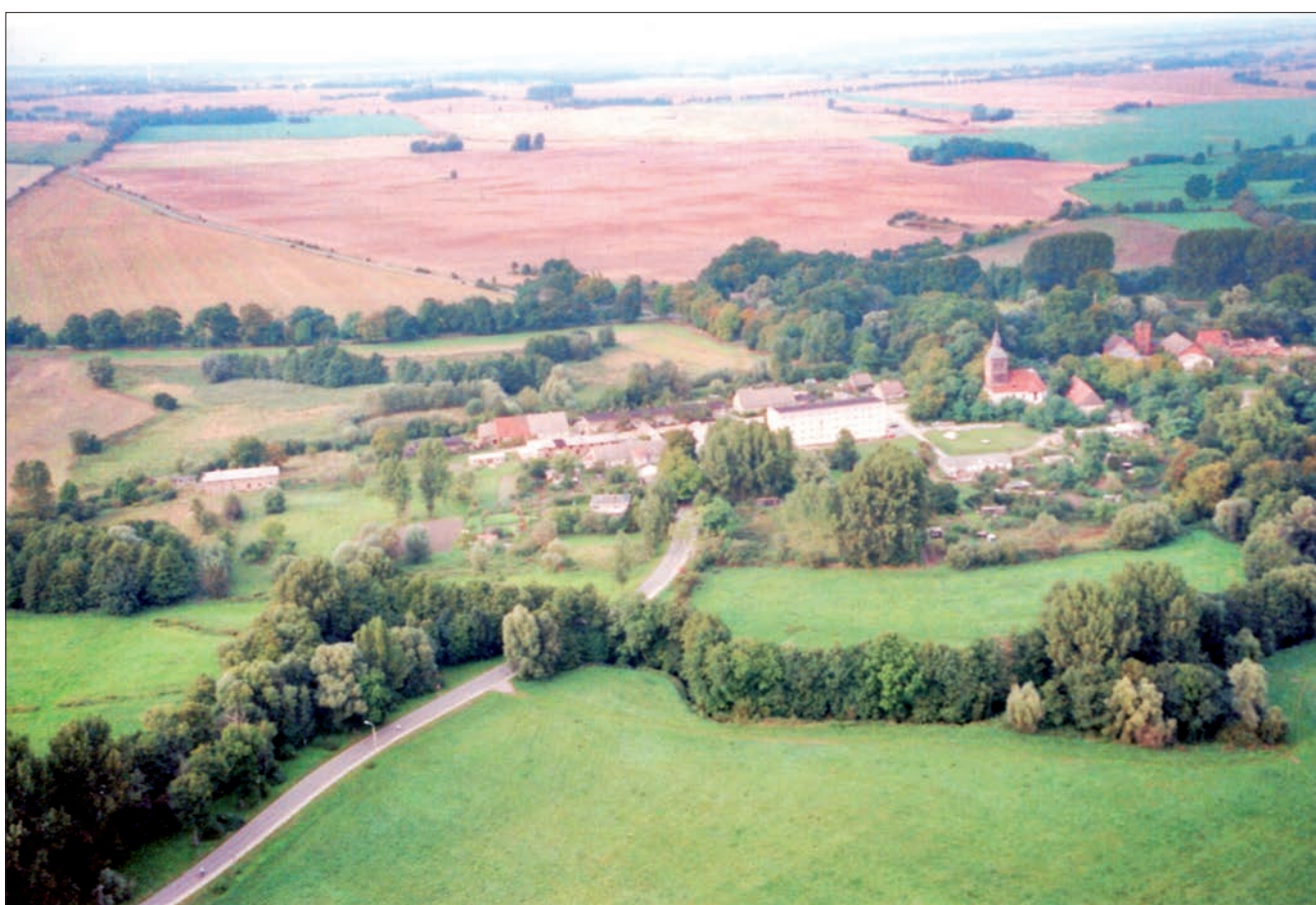
Luftbildaufnahme von Taschenberg