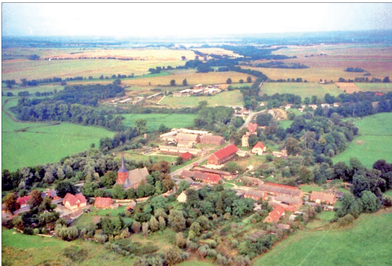
Luftbildaufnahme von Jagow