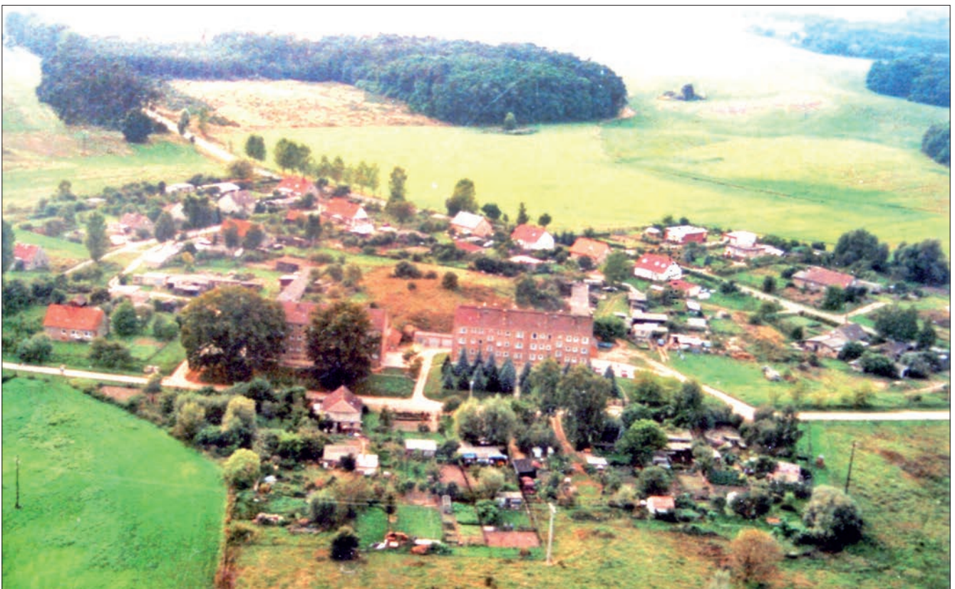
Luftbildaufnahme von Kutzerow