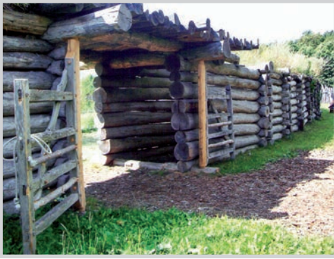
Befestigungsanlage einer Slawensiedlung