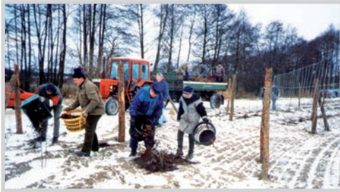
Heckenpflanzung am Seeweg, 1998