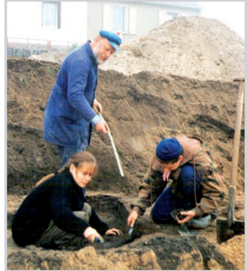
Auf der Baustelle, Am Mühlberg 10, in Naugarten