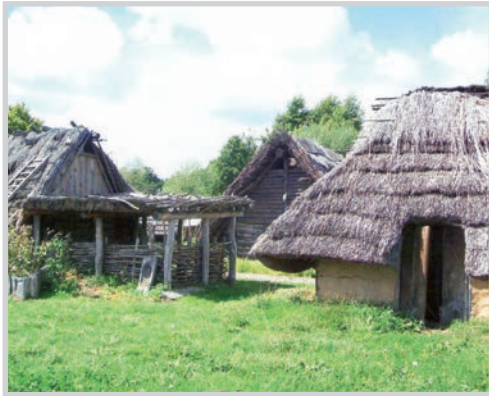
Ukranensiedlung (Foto: Ukranenland Torgelow, 2010)