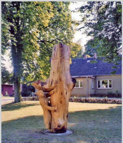
Mutter Molkasch 2006