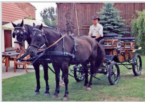
Abb. 82 a: Der Besitzer dieses schmucken Gespannes bietet Kremser- wie Kutschfahrten und auch Reitstunden an; Quelle: G. Mante