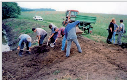
Errichtung eines Vorstaugrabens am See, 1997