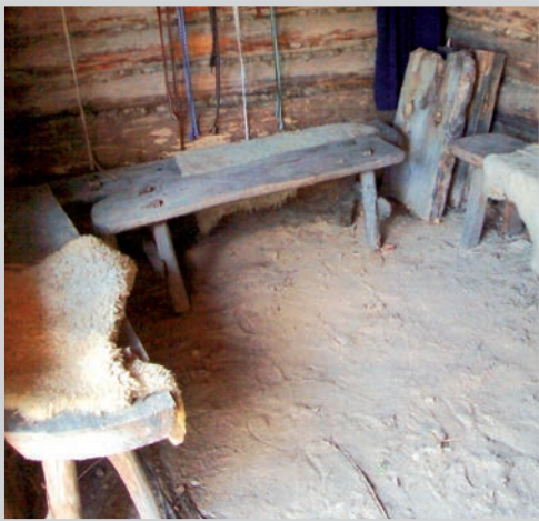
Blockhaus von innen