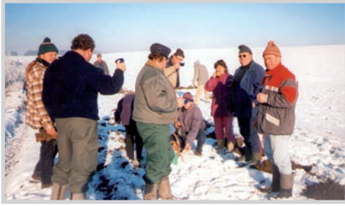
Glühwein zum Erwärmen