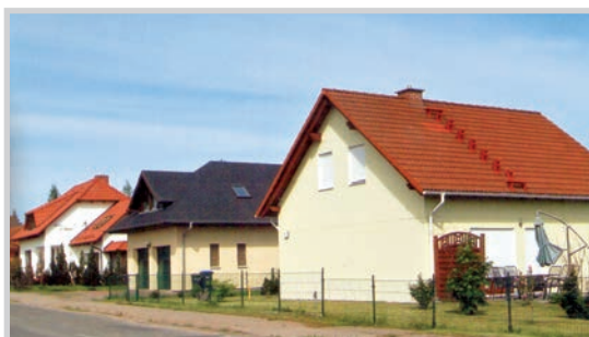
Baubeginn „Am Mühlenberg“ war 1996