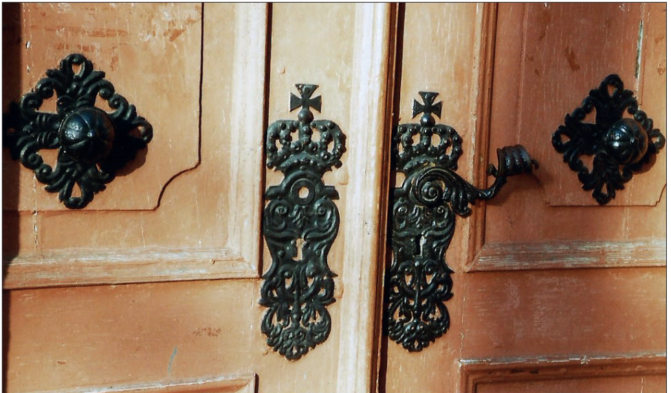
Maria-Magdalenen-Kirche – Türschloss

30.01. Hast du schon deine Spende für deutsche Soldatenheime abgeschickt?