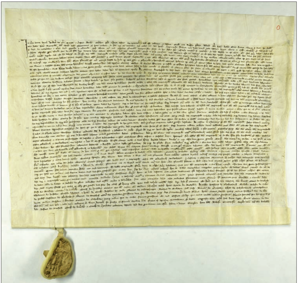
Urkundekopie – Landeshauptarchiv Schwerin

Nach anfänglichen friedlichen Beziehungen kam es zu erneuten Streitigkeiten.