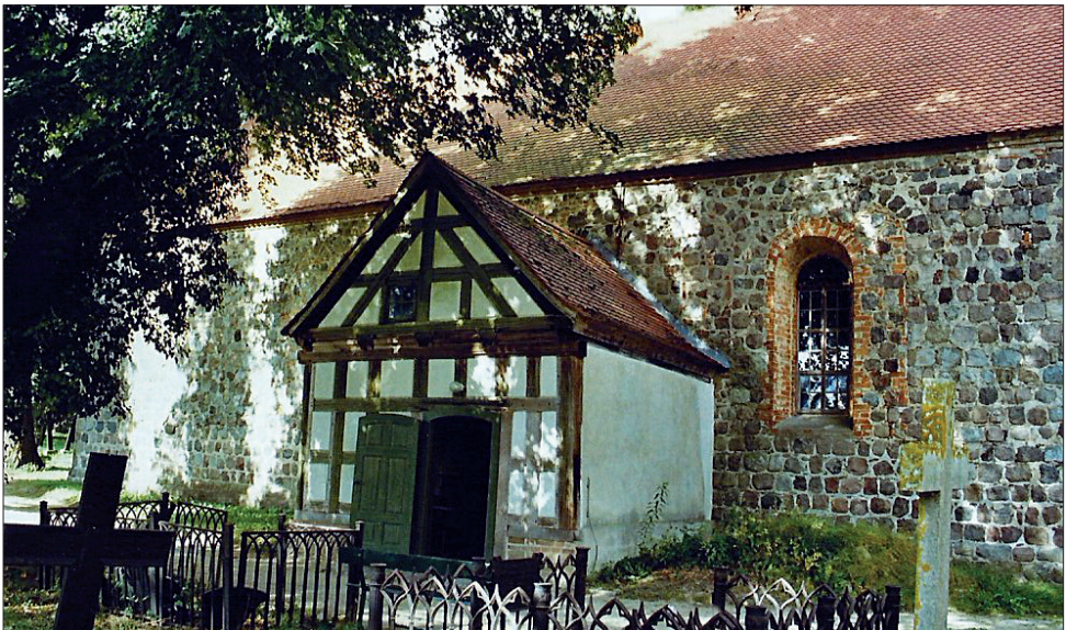
Thomsdorf Turmloser Feldsteinbau 13 Jh., Eitel Knitter

30.01. Die Reichsstelle für Gemüse gab die Freigabe von Dörrgemüse bekannt.