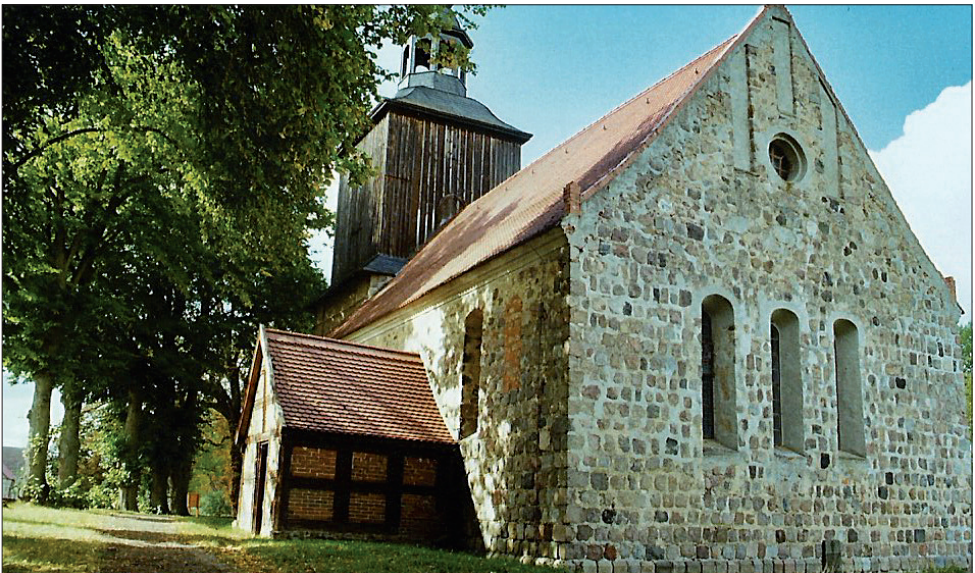
Hardenbeck 1250 Feldsteinbau, Eitel Knitter

27.02. Ausgebessertes Militärschuhwerk ist ohne Bezugschein erhältlich.