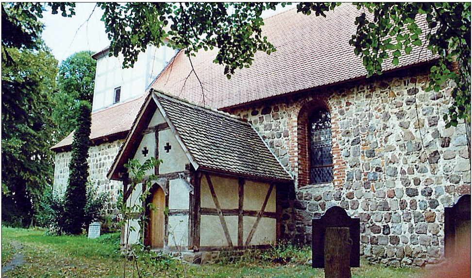
Berkholz: Feldsteinbau 2 Hälfte 13 Jh, Eitel Knitter

29.03. Unser Elisabeth-Frauenverein ist der Evangelischen Frauenhilfe angegliedert.