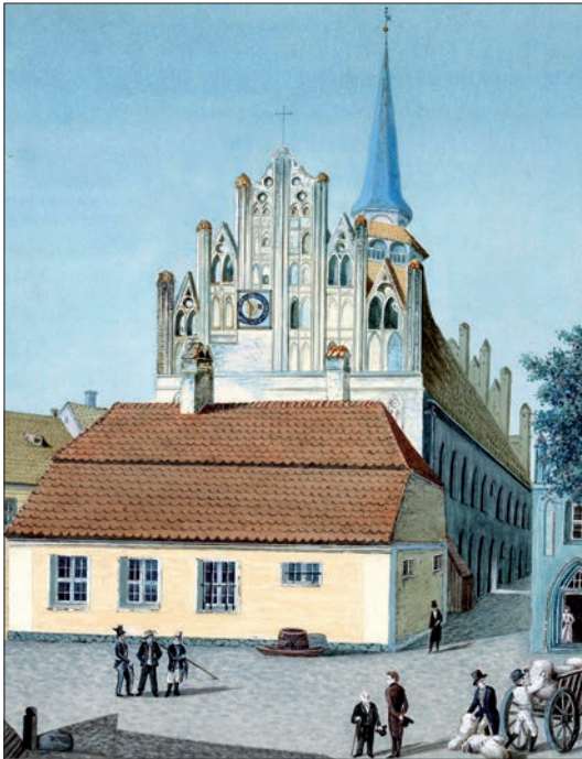
Ostseite des alten Rathauses, gemalt von Karl von Hoewel*

Weiterhin teilte er mit: „Im Familienbuch, verfasst von Karls erstem Sohn Karl steht: „Im Jahre 1841 sind die Wasserfarbengemälde des Anklamer Rathauses, die in Anklam lithographisch vervielfältigt wurden, hergestellt ...“ 47