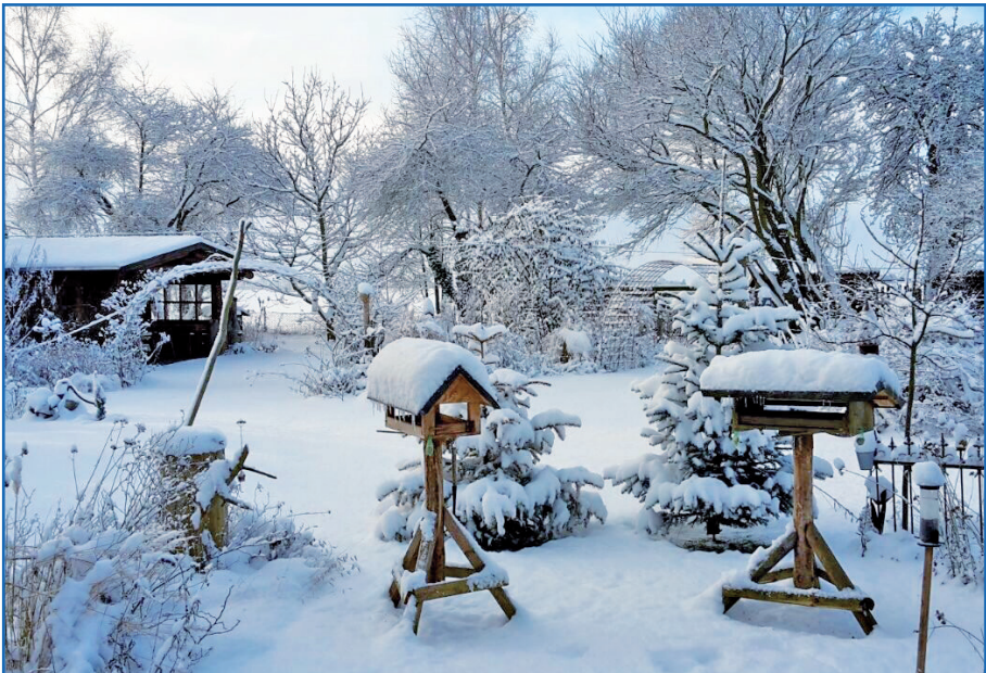
Tiefer Winter auf dem Land