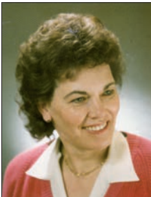
Jg. 1939, geb. Kaeselitz

Vogelgesang, von Ferne lustiges Kindergeschrei, aus der Stille tret ich hervor, lustiges Kinderlachen dringt an mein Ohr, welch eine Freude, erlebendes Glück. Sehnt man sich heimlich die Jugend zurück?