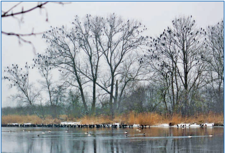
Hungrige Kormorane an der Anklamer Peenebrücke

23.02.1984: Uwe Johnson, Schriftsteller, verstorben