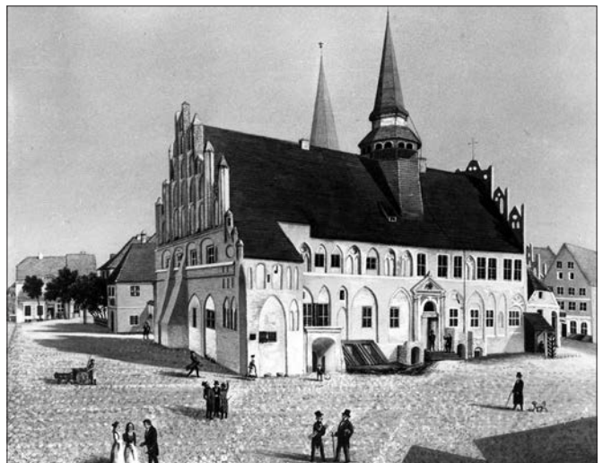
Nachdruck von Loeillot de Mars in Berlin*

In vielen Anklamer Wohnzimmern zierten die Lithographien die Wände. Auf den Drucken waren nicht alle Personen, die Hoewel dargestellt hatte, abgebildet.