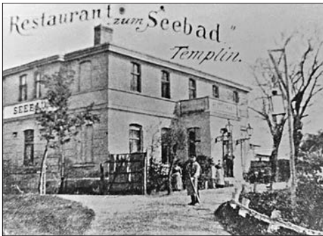
Hotel-Restaurant „Seebad“, Arnimstraße, 1900

Im gleichen Zeitraum war 1855 auf dem damaligen Grundstück Nr. 7 das „Restaurant Seebad“ mit einer für Männer und Frauen getrennten Badeanstalt entstanden. Der damalige Besitzer Ludwig Friedrich Schumacher betrieb gleichzeitig einen Bootsverleih sowie eine Badeanstalt nach Damen und Herren getrennt. Um 1909 wurde das Haus zum Hotel-Restaurant „Seebad“ mit Kursaal und Gelbahn erweitert.