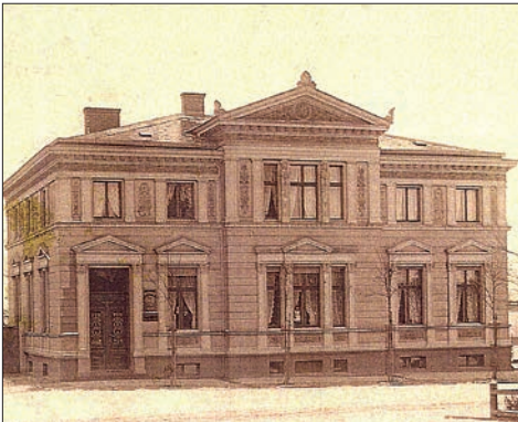
Villa Ihrke, Arnimstraße 1, Archiv

1870 baute Familie Ihrke in der Arnimstraße 1 eine klassizistische Villa, in der sie bis 1928 das erste private Bankgeschäft in der Stadt führten. Heute ist das Gebäude Sitz des „Jugendhauses Villa“ und des „Kunstvereins Templin“.