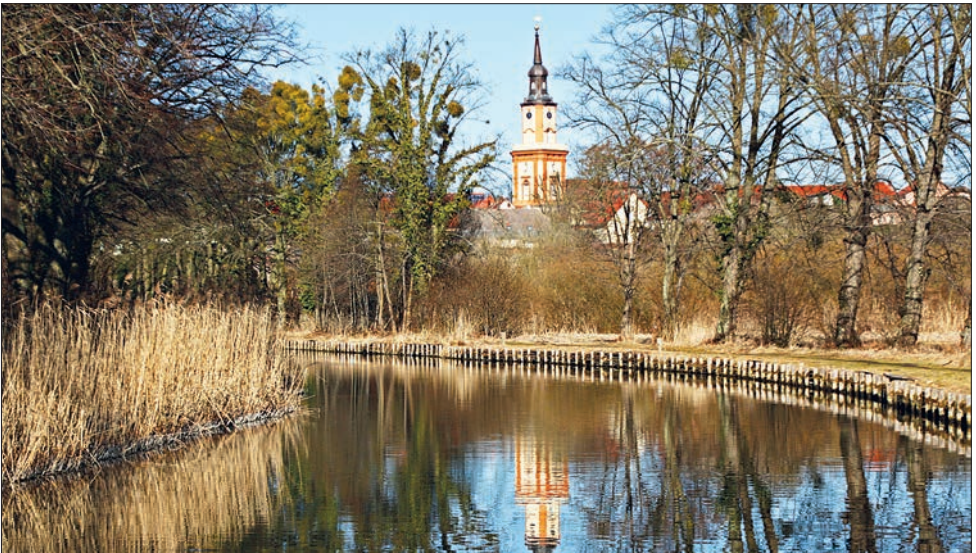
Templiner Kanal, Sicht auf M.-M.-Kirche

28.02. Die Märzmietten bleiben in Preußen unverändert.