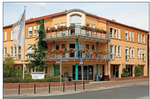
Seniorenheim „Richard Kirstein“

Im Juli 2004 wurde auf dem Gelände der früheren „Privatschule“ und des „Knabenrettungshauses“ das neue Seniorenzentrum „Richard Kirstein“ in der jetzigen Prenzlauer Allee 2-3 eingeweiht.