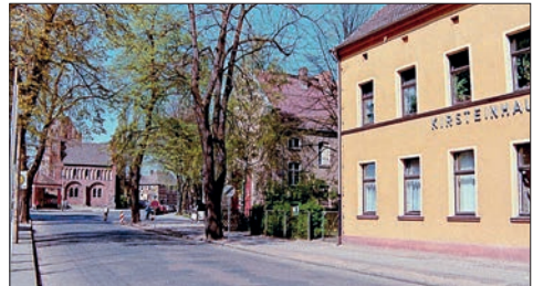
Kirsteinhaus, Prenzlauer Allee 2, B. Makowitz