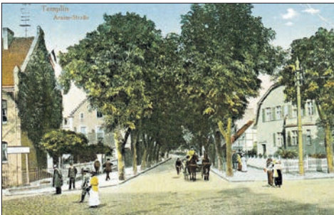
Arnimstraße 2

Wurde die Schule anfangs mit eigenen Mitteln betrieben, beteiligten sich ab 1900 auch Stadt und Kreis, so dass ab 1902 sieben Freistellen für minderbemittelte, aber lernbegabte Kinder eingestellt werden konnten. Diese Plätze wurden jährlich neu vergeben.