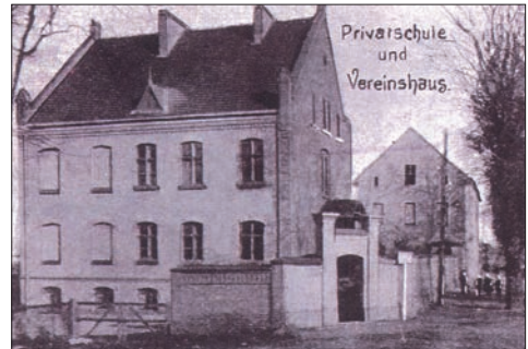
Privatschule mit Vereinshaus