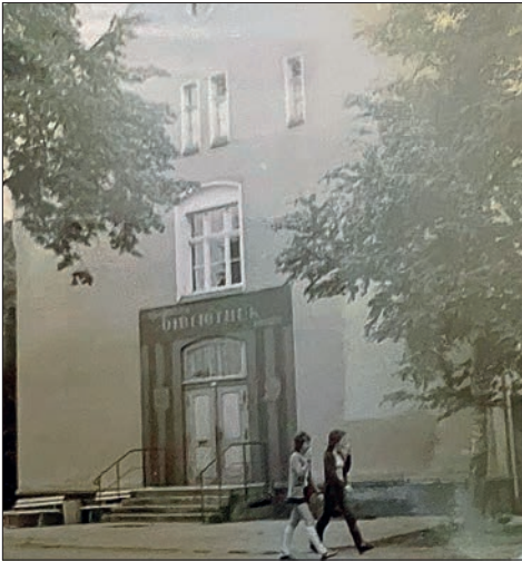
Kreis- und Stadtbibliothek (Archiv)

von Kreis- und Stadtbibliothek erfolgte, wurde diese am 11. April 1957 erneut in der damaligen Wilhelm-Pieck-Straße 2 eröffnet.