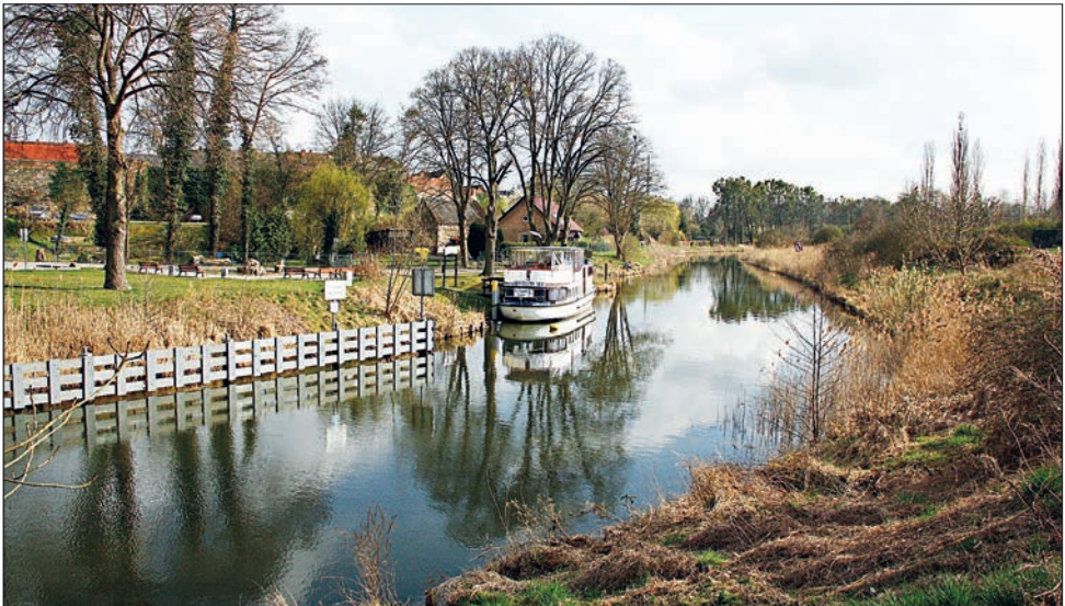
Ausflugsdampfer „Uckerperle“, FA. Herborn, auf dem Templiner Kanal

28.01. Die Fischereiverpachtung der hiesigen Seen findet am 19.02. statt.